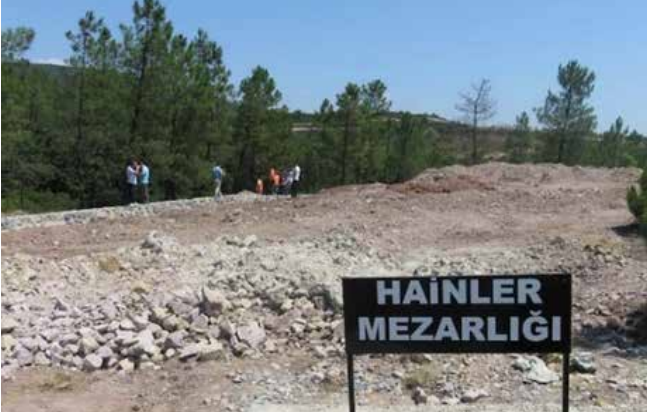
Türkiye'nin en büyük belediyesinin en büyük projesi 15 Temmuzla mücadele adı altında "Hainler Mezarlığı" inşa etmesidir...