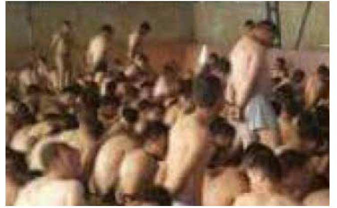
15 Temmuz Kumpası... Cadı Avının sembolü olmuştur

Yukarıda belirtilen süreç, nefret söylemiyle başlayıp nefret suçuna dönüşen bir metaforun, yani cadı avının, özetidir. Bu metafor, siyasi iktidarın hedef aldığı masumlara yönelik sosyal soykırımdır.