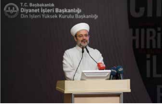
2016 Ağustos Olağanüstü Din Şurasında "FETÖ/ PDY dinlerarası diyalog adıyla kelime-i tevhidi parçalayan bir harekettir" mesajı yayınlanmıştır...