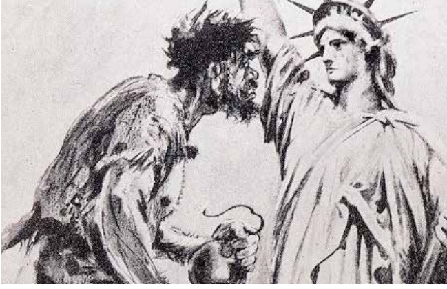
ABD'de komünist olarak hedef alınan kişilere yönelik sürdürülen cadı avı...