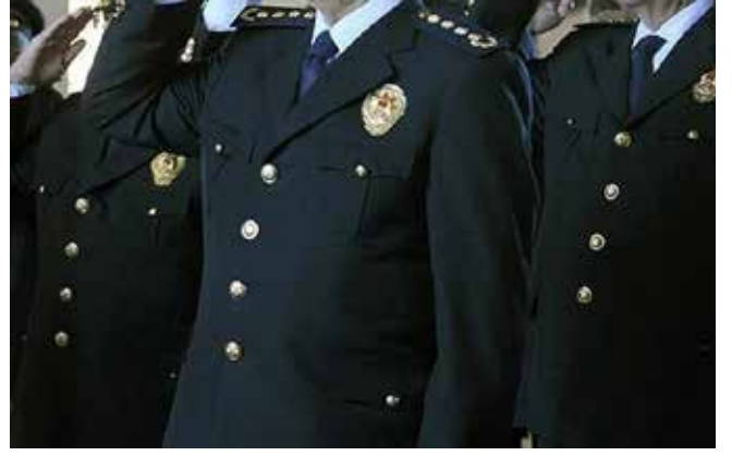
17/25 Aralık Yolsuzluk Operasyonlarından sonra görevlendirilen kollukta liyakatin yerini sadakat almış, işkence ve kötü muamele geri gelmiştir...

Diyanet kadar çaba gösteren bir başka bürokratik yapı Kolluk adı altındaki Emniyet ve Jandarma ile güvenlik birimleri Ordu ve İstihbarat Teşkilatıdır. Asli vazifesi iç güvenliğin sağlanması olan kolluk birimleri, hukukun üstünlüğü ya da insan hakları gibi temel değerlerden uzaklaştıkça bir yandan rejim adına suç işleyen diğer yandan nefret söylemini şiddet uygulamalarıyla birlikte devletin arşivine ve toplumun hafızasına kazımaya çalışan yapılara dönüşmüştür. Gülen Hareketine yönelik önceden hazırlanan iddianameler, fişleme listeleri, etkin pişmanlık adı altında işkenceyle atırılan imzalar, basın açıklamaları, medya üzerinden halkla ilişkiler çalışmaları, kamuoyuna servis edilen kitlesel gözaltılar, işkence ve kötü muameleler, adam kaçırmalar ve kayıplar, film setlerini aratmayacak operasyon görüntüleri, iç ve dış kamuoyunu yanlış bilgilendirmeye yönelik hazırlanan raporlar, uluslararası sistemi kötü kullanmaya yönelik manipülasyonlar, Gülen Hareketini uluslararası terörizm literatürüne/örgüt listelerine ekleyebilmek amacıyla ortaya konan ikili ve çok taraflı anlaşmalar/organizasyonlar, etkin pişmanlık adı altında itirafçılık mekanizmasını genişletme, kapı kapı dolaşarak fişlenen hedef kişileri komşularına ihbar etme,