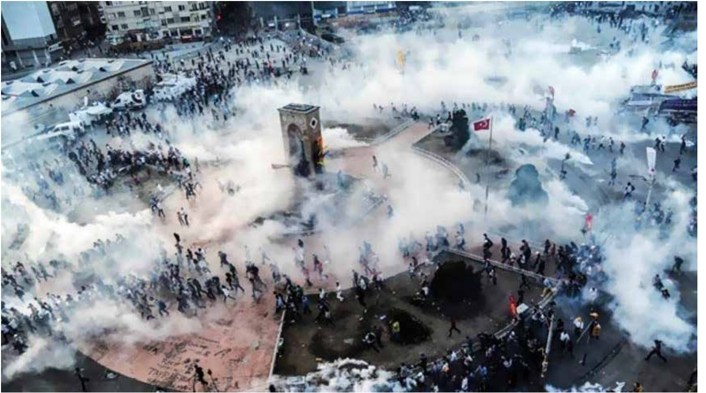
2013 yılındaki Gezi Olayları Erdoğan Rejimini epeyce korkutan ve iktidarın saldırgan politik bir söyleme sarılmasına neden olan önemli bir olay olarak tarihe geçmiştir...

Siyasi iktidarın uzlaşmacı dili bir yana bırakarak hedef gruplara yönelik saldırgan bir stratejiye sarılması 2013 yılındaki Gezi Olaylarıyla açığa çıkmıştır. Bahse konu tarihten itibaren Erdoğan Rejiminin destekçisi olmayan tüm gruplar yaşına, cinsiyetine, mesleğine, fiziki sağlık durumuna bakılmaksızın vakti geldikçe "terörist, terör örgütü üyesi, terör örgütü, hainler" gibi etiketlemelerden ve de cezalandırmalardan nasibini almıştır.