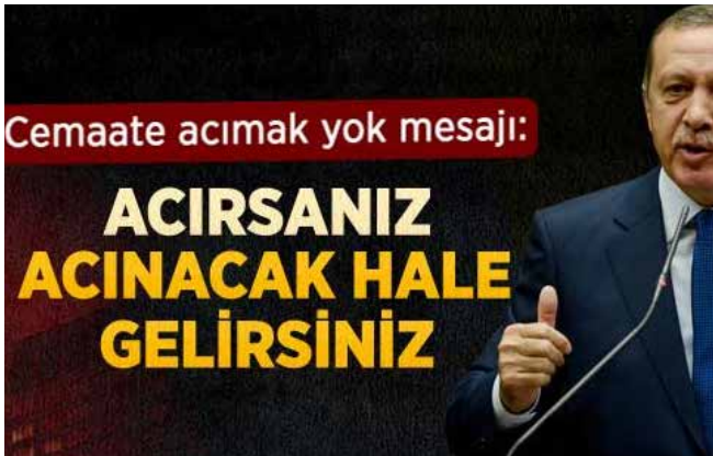
"Acırsanız acınacak hale gelirsiniz" mesajı... Cadı Avının sembolü olmuştur...