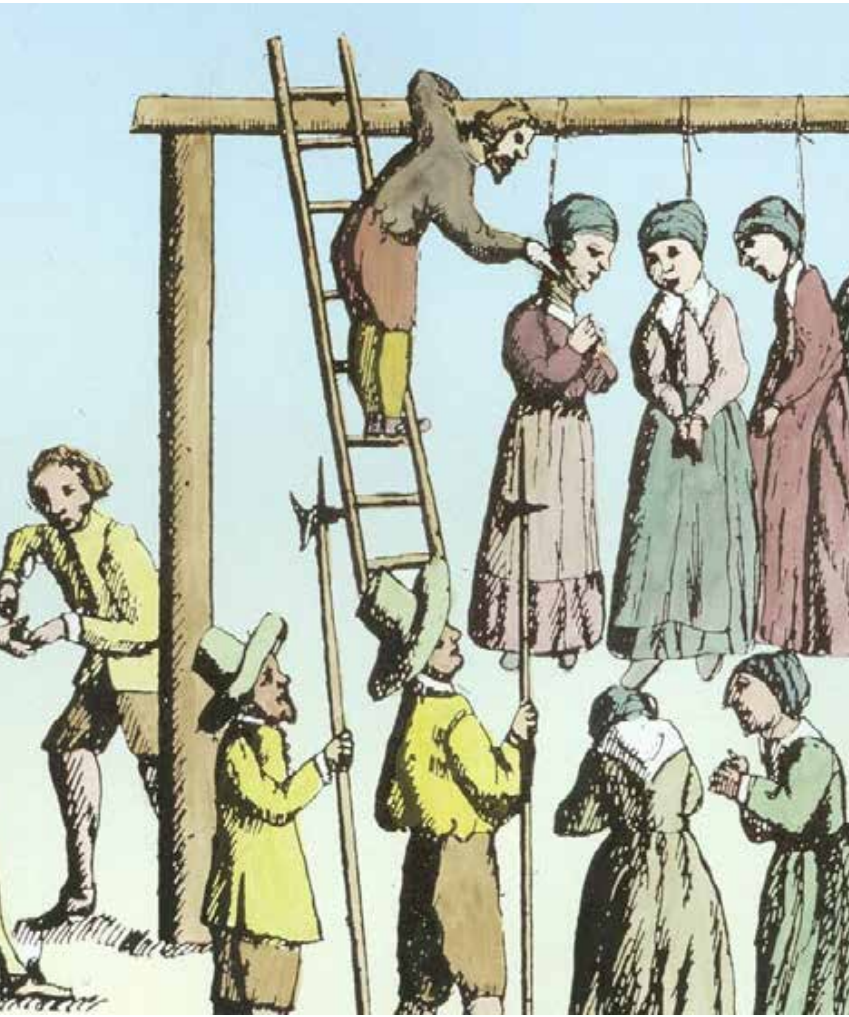
İngiltere'de cadı olarak adlandırılan kadınların öldürülmesi...

Cadı avı , cadı olduğuna inanılan kimselerin dönemin şartlarına göre göstermelik biçimde yargılanarak ya da hiç yargılanmadan cezalandırılması olayıdır. Cadı avının tarihsel bir arka planı vardır ve genellikle hedef kişilere yönelik "cadı" etiketiyle bir şeytanlaştırma söz konusudur. Geçmişte cadı avının hedefi genellikle kadındır ve cezalandırma şekli linç ya da yakmadır. Cadı avında yaşananların bir benzeri ise Katolik Kilisesine bağlı mahkeme olan Engizisyon uygulamalarında yaşanmıştır. Engizisyonun hedefi olan kişiler ve gruplar çok ağır biçimde cezalandırılmış, kilisenin elinden kurtulabilenler buldukları yeri terk etmek zorunda kalmıştır. 20 yy.dan itibaren cadı avı, düşünceleri ve fikirleri politik iktidar için tehlikeli ve tehdit olan kişilere ve gruplara yönelik mekanizmaya dönüşmüştür. Soğuk Savaş döneminde ABD'de McCarthycilik ortaya çıkmış, cadı avı olarak tanımlanan bu dönemde "komünist" olarak etiketlenen hedef kişiler iktidarın ve destekçilerinin saldırısına uğramıştır. Bahse konu kişiler önce işini kaybetmiş daha sonra tutuklamalara varan adli soruşturmalara konu olmuştur.