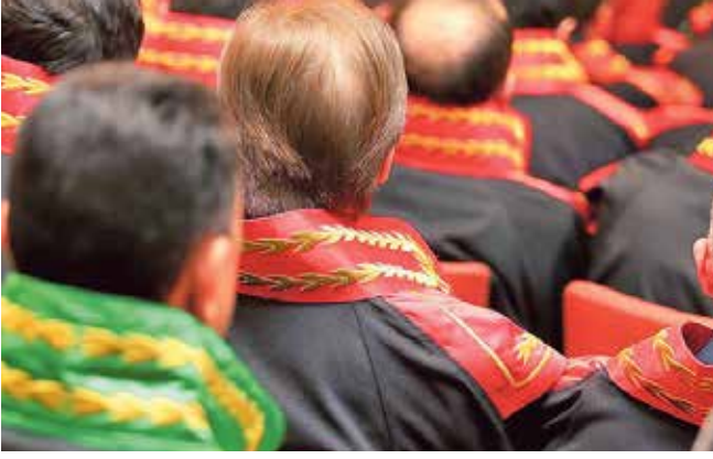
15 Temmuz Cadi avındaki her tutuklamayı Umre sevabı olarak değerlendiren emirleri hakimler ortaya çıkmıştır...